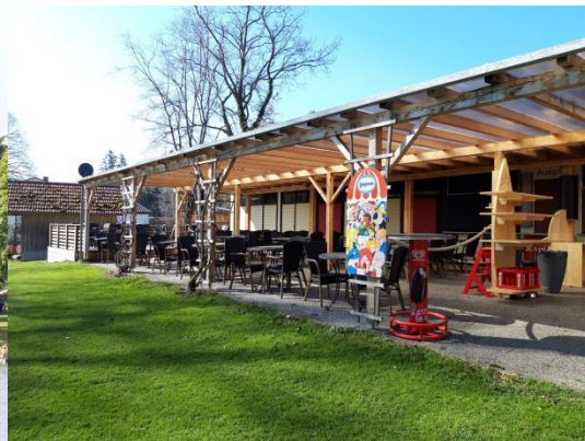
Kiosk, Ansicht von Süden